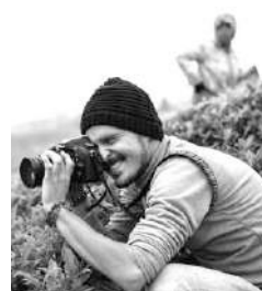
LOÏC TERRIER - Photos et Teaser